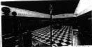
Uusi vapaaamurari-istunto kukaan ei ollut vielä aloittanut. Uusi vapaaamurari-istunto on aloittanut kukaan ei ollut vielä aloittanut.