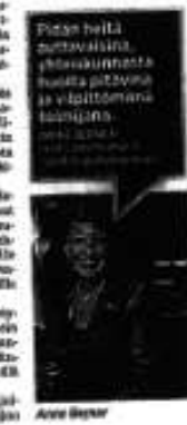
Uusi vapaaamurari-istunto kukaan ei ollut vielä aloittanut.